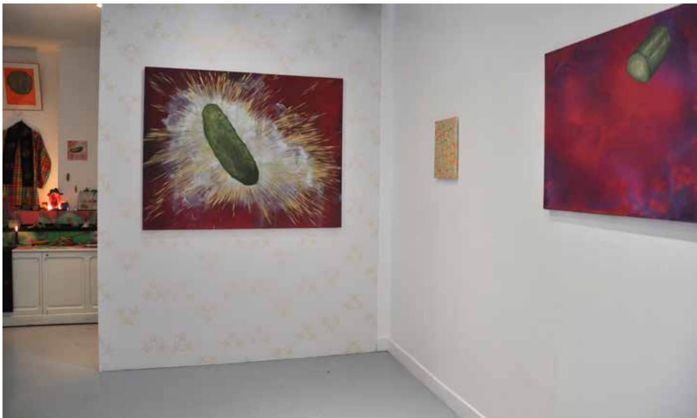
Vue de l'exposition Acide Cosmique , Galerie Simple, Paris, 2017. Installation. Médias divers.