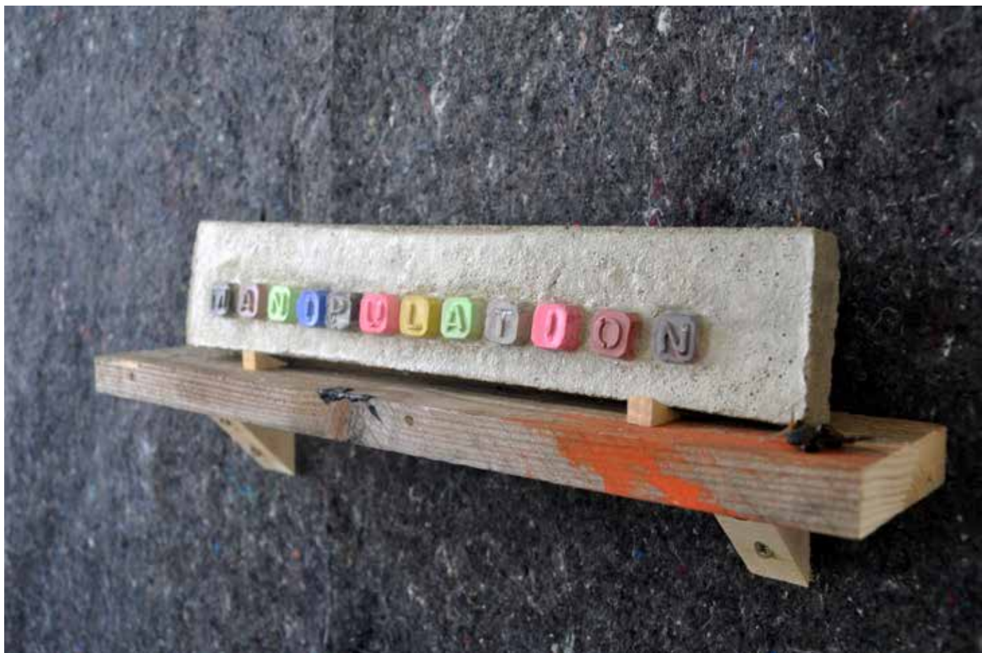
Vue d'atelier, 2017, série Memento Moris, Manipulation, bâche de protection agrafée au mur, étagère en bois, béton, pigment, env. 180 x 140 cm.