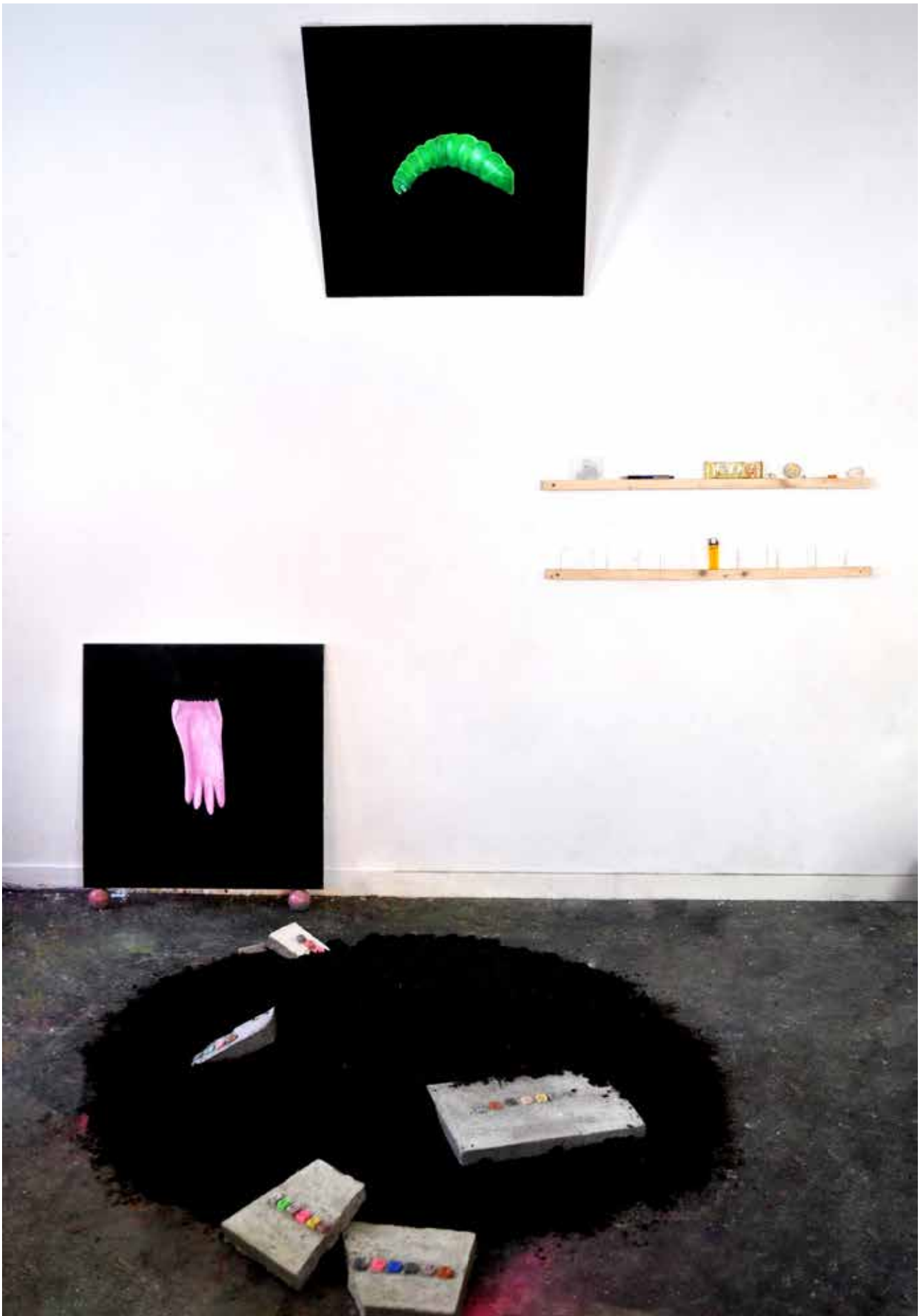
Le mythe de la banalité , installation, 2017, peintures (huiles sur toile 65 x 65 cm), tasseaux de bois vissés au mur, objet divers, enveloppes en papier cousues, boules en béton coloré, dalles en béton, pigment, terre.