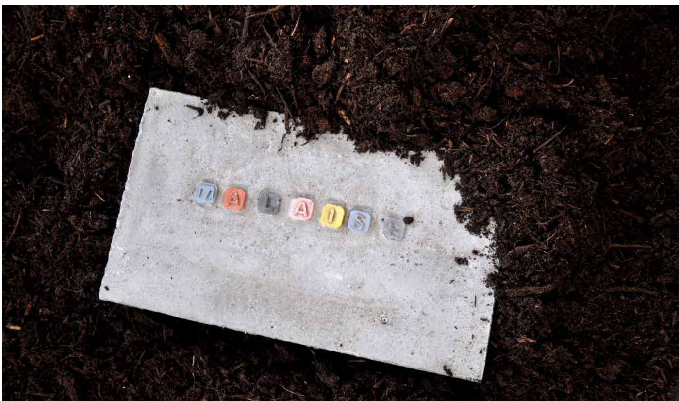
Détail, Le mythe de la banalité, Memento moris , 2017, dalles en béton, pigment, terre.