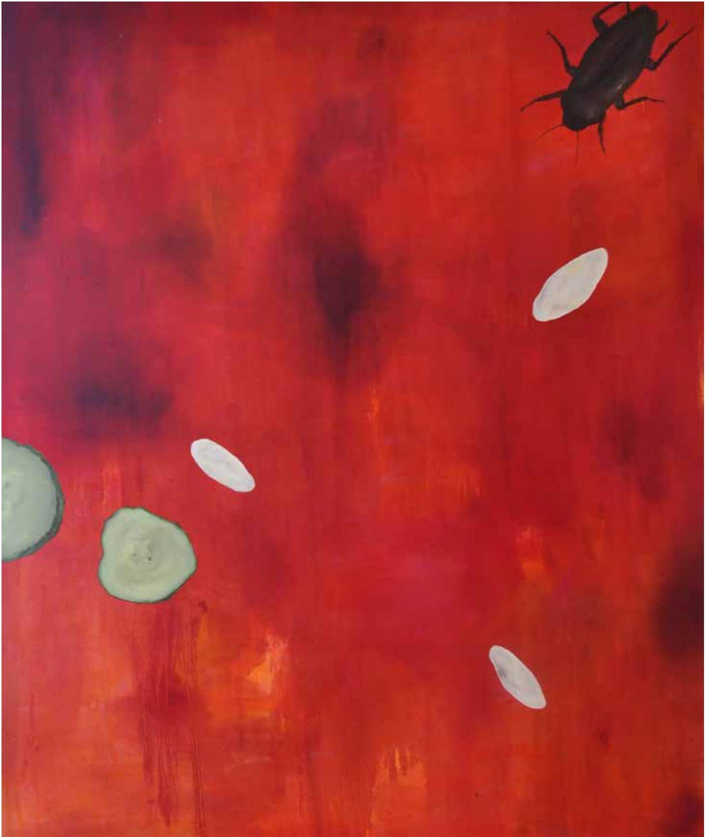
Gokiburi dans l'espace Métaphysique , 2015-2017, huile sur toile, 180 x 150 cm.