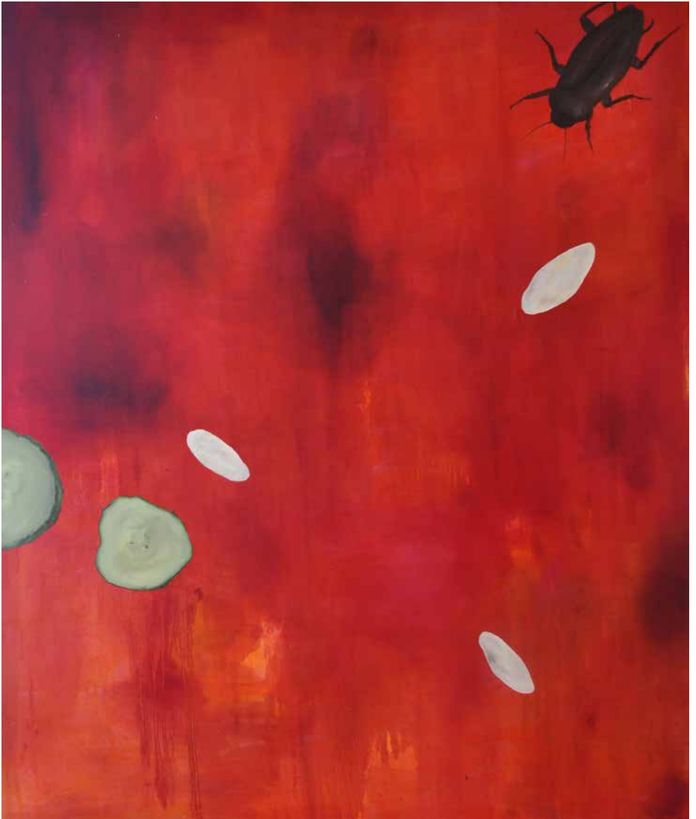
Gokiburi dans l'espace Métaphysique , 2018, huile sur toile, 180 x 150 cm.