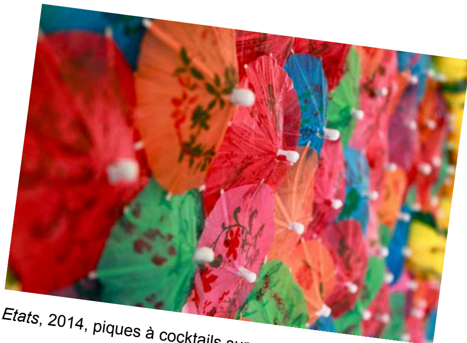
Etats, 2014, piques à cocktails sur mur, env. 180 x 60 cm.