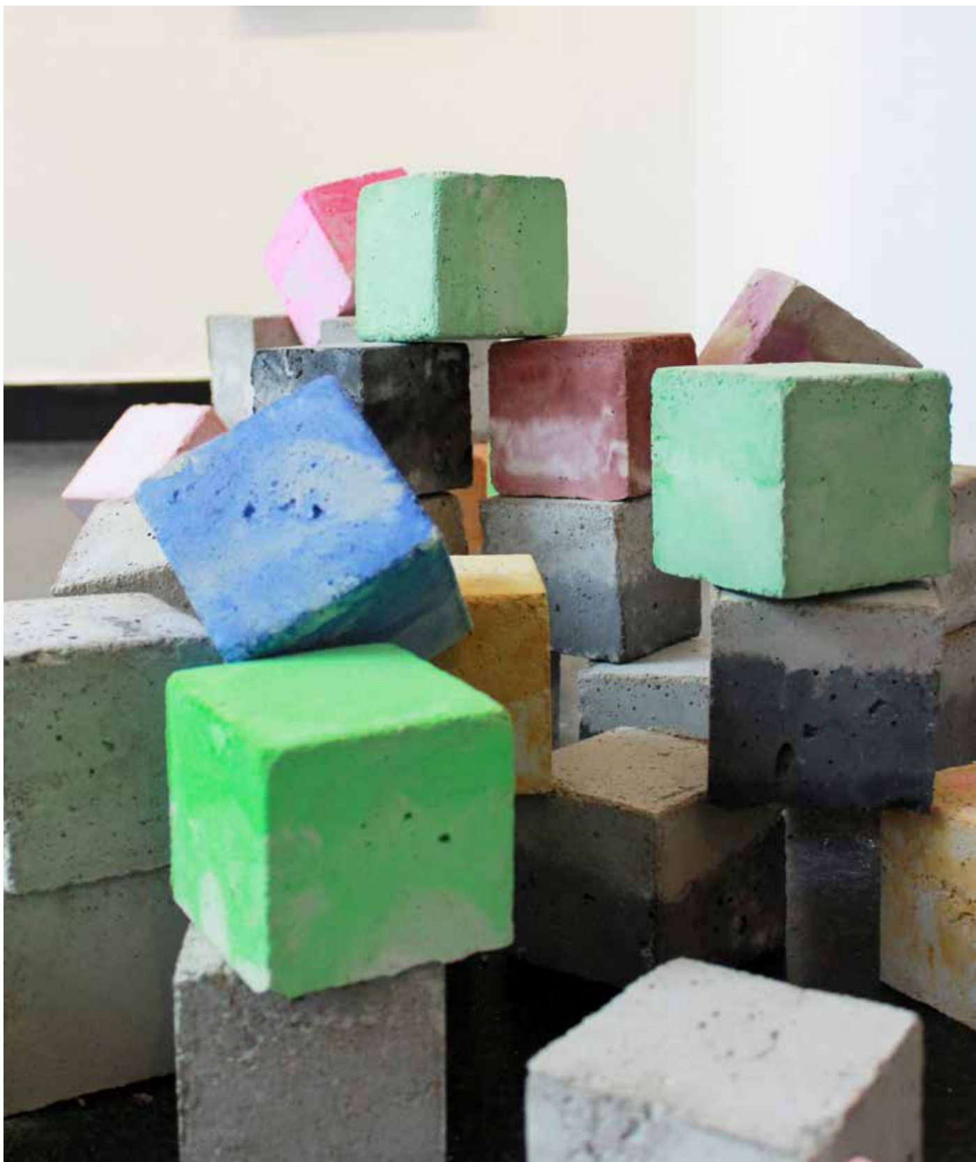
Nipponeries , 2015, env. 50 cubes, béton, pigments, 8 x 8 x 8 cm chaque;