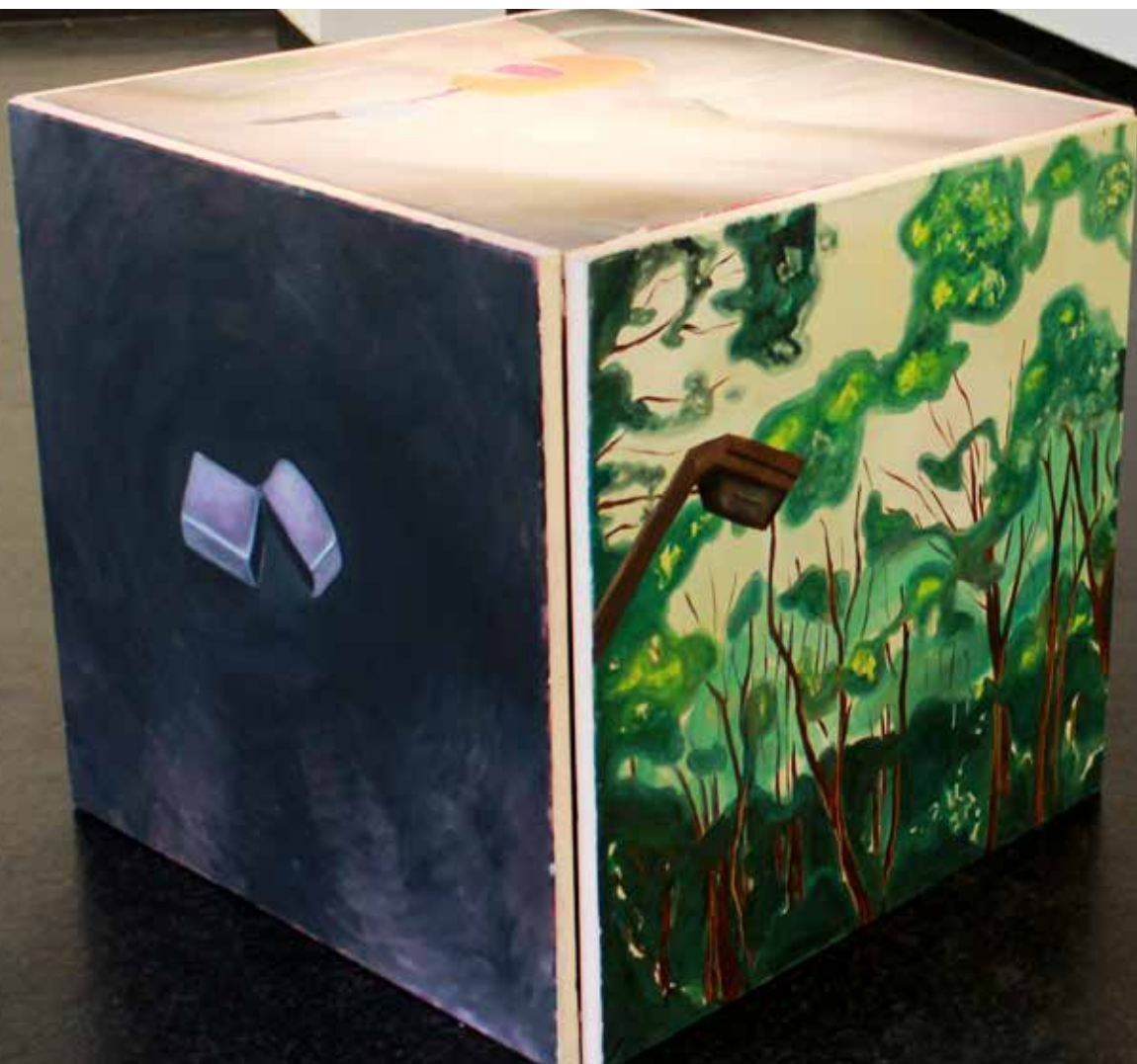
Nipponeries , 2015, huiles sur toile, 65 x 65 cm. La série est composée de 3 cubes composés de 5 toiles chaque.