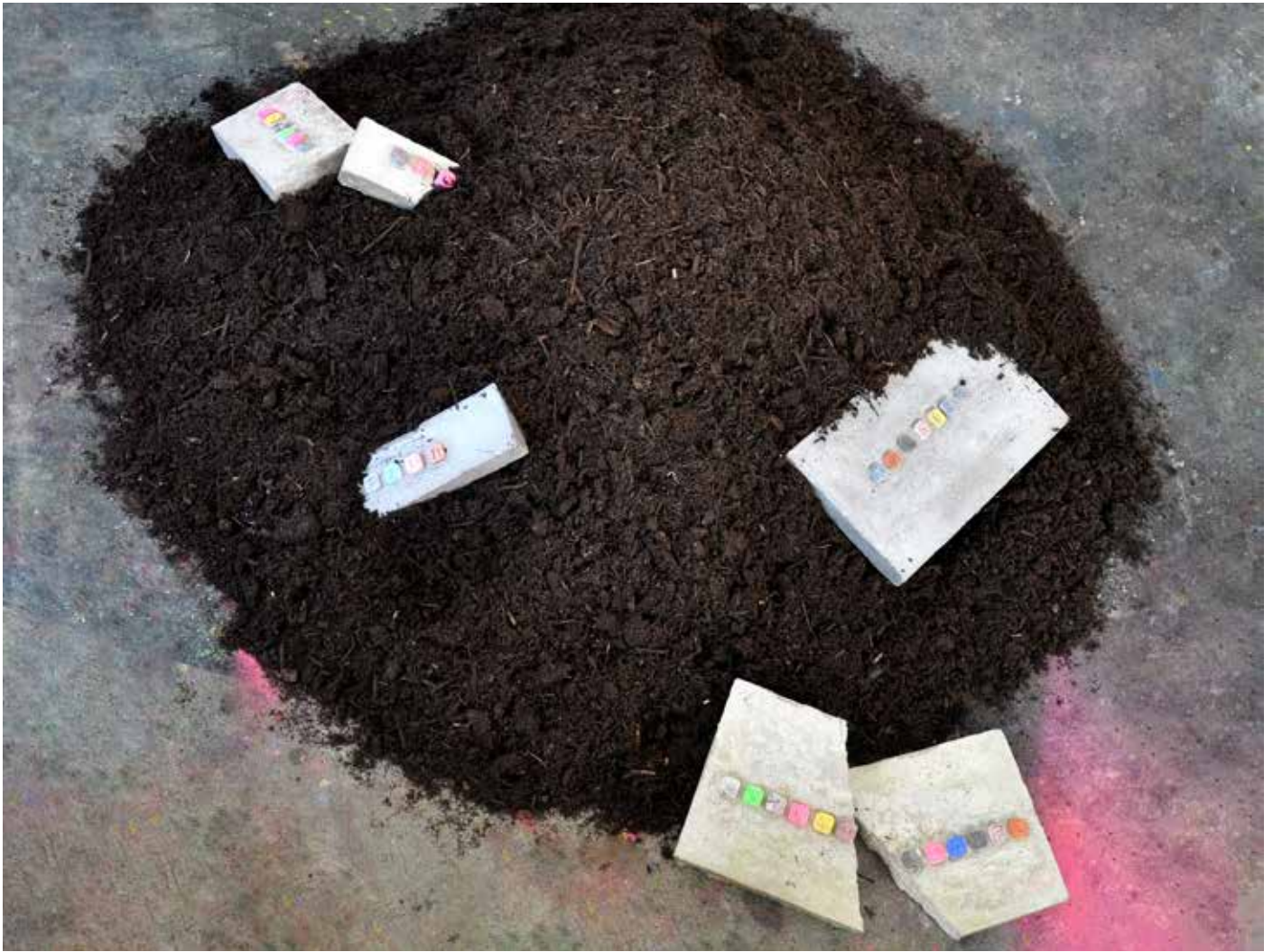
Détail, Le mythe de la banalité, Memento moris , 2017-2018, dalles en béton, pigment, terre.