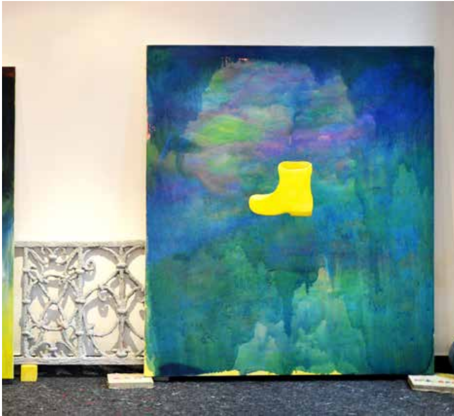
Vue de l'exposition, L'été passe, je soulève un store, je ne regarde rien , Galerie de Mézières, Eaubonne. 2017, Installation. Eden, 2015, huile sur toile, 180 x 150 cm; rambarde en béton; dalles en béton; bâche de protection.

Installation, médias divers ( bâche de protection, huiles sur toiles, dalles en béton, huiles et sérigraphies sur papier arches sur structure hexagonale.)