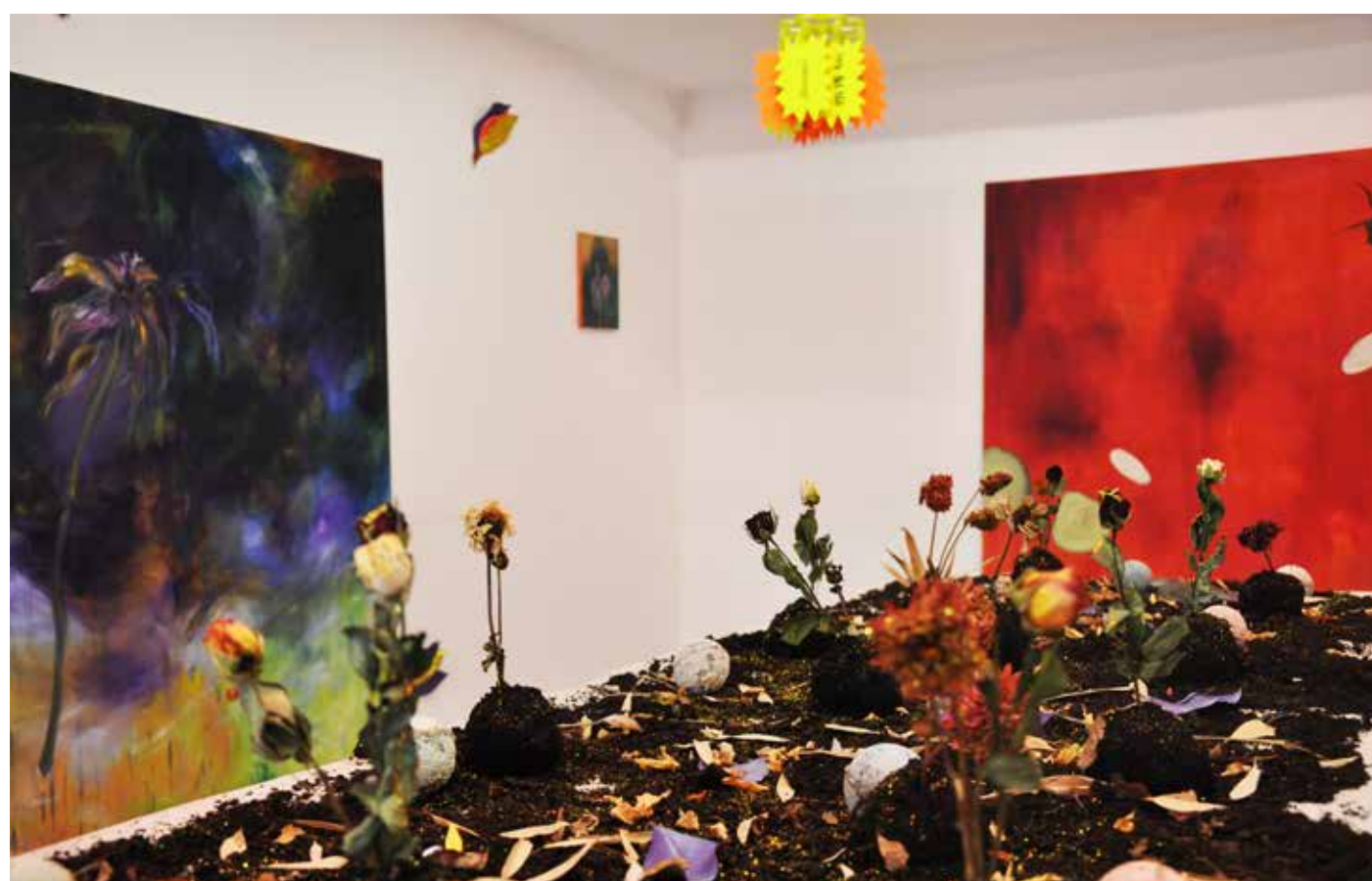
Le Muséum de la Banalité, vue d'installation, 2018, huiles sur toile de formats divers, terre, fleurs séchées, feuilles mortes peintes, paillettes, boules en torchi (fleurs séchées, chaux et pigments), cafard en céramique, séchoir à linge, plaquette de promotions.