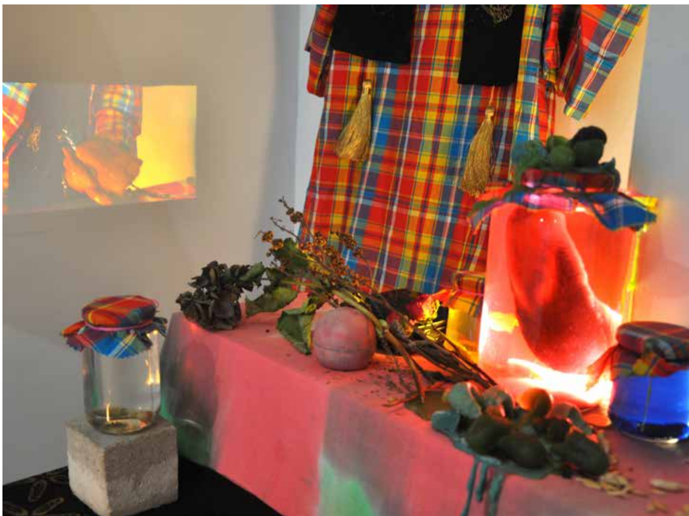
Détail, Vue de l'exposition Acide Cosmique , Galerie Simple, Paris, 2017. Autel à la gloire du cucurbitacée Cornichon , bougies de cornichon moulé, bocaux de cornichons cultivés en atelier mis en saumure, cornichons en céramiques, costume de cérémonie, vidéo de rituel.