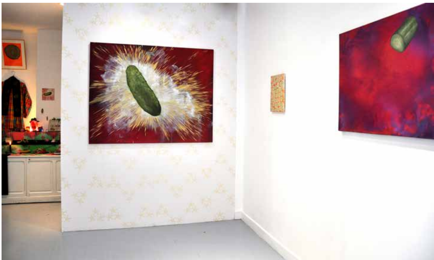
Vue de l'exposition Acide Cosmique , Galerie Simple, Paris, 2017. Installation. Huiles sur toile, papier peint sérigraphié et médias divers.