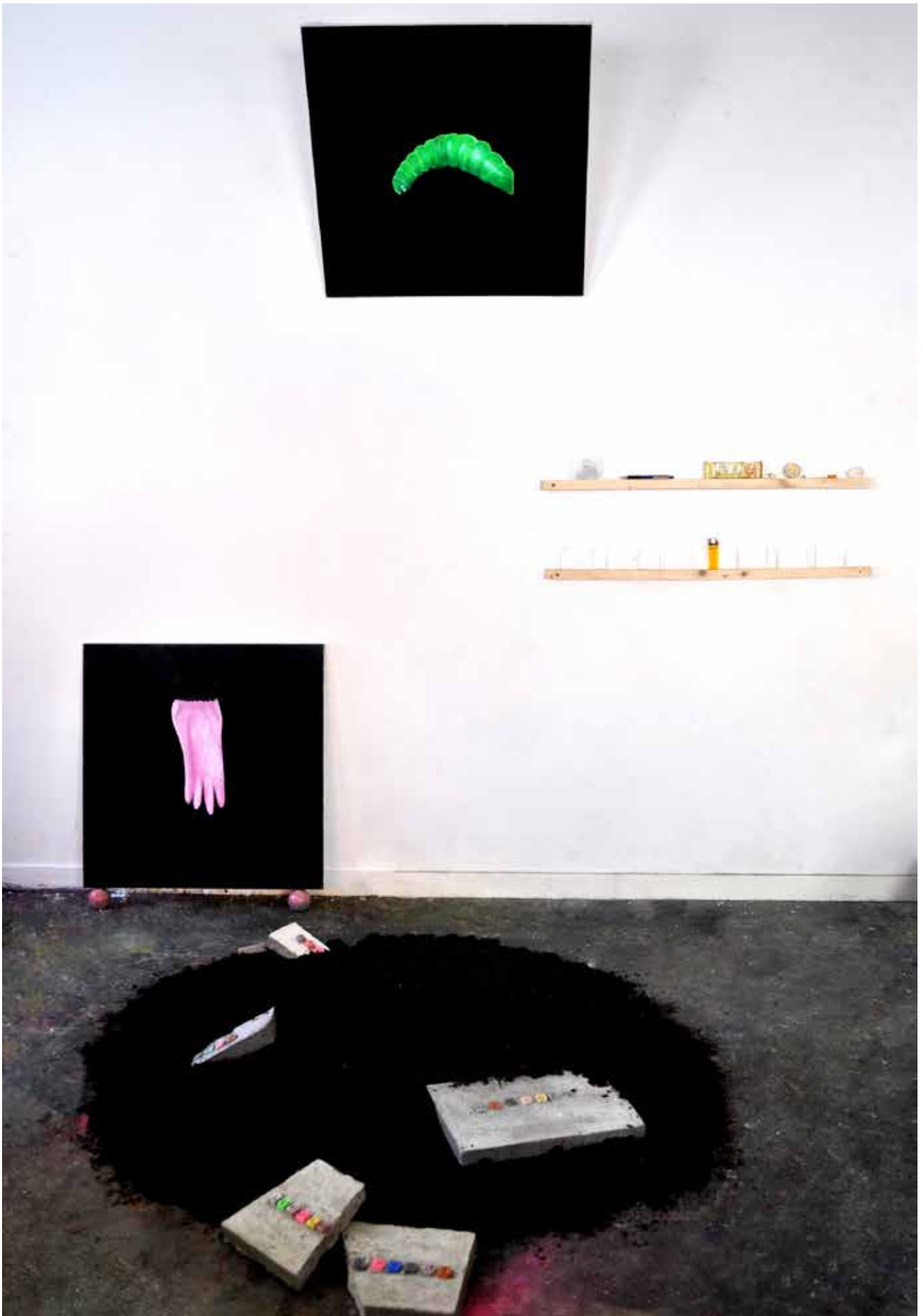
Le mythe de la banalité , installation, 2017-2018, peintures (huiles sur toile 65 x 65 cm), tasseaux de bois vissés au mur, objet divers, enveloppes en papier cousues, boules en béton coloré, dalles en béton, pigment, terre.