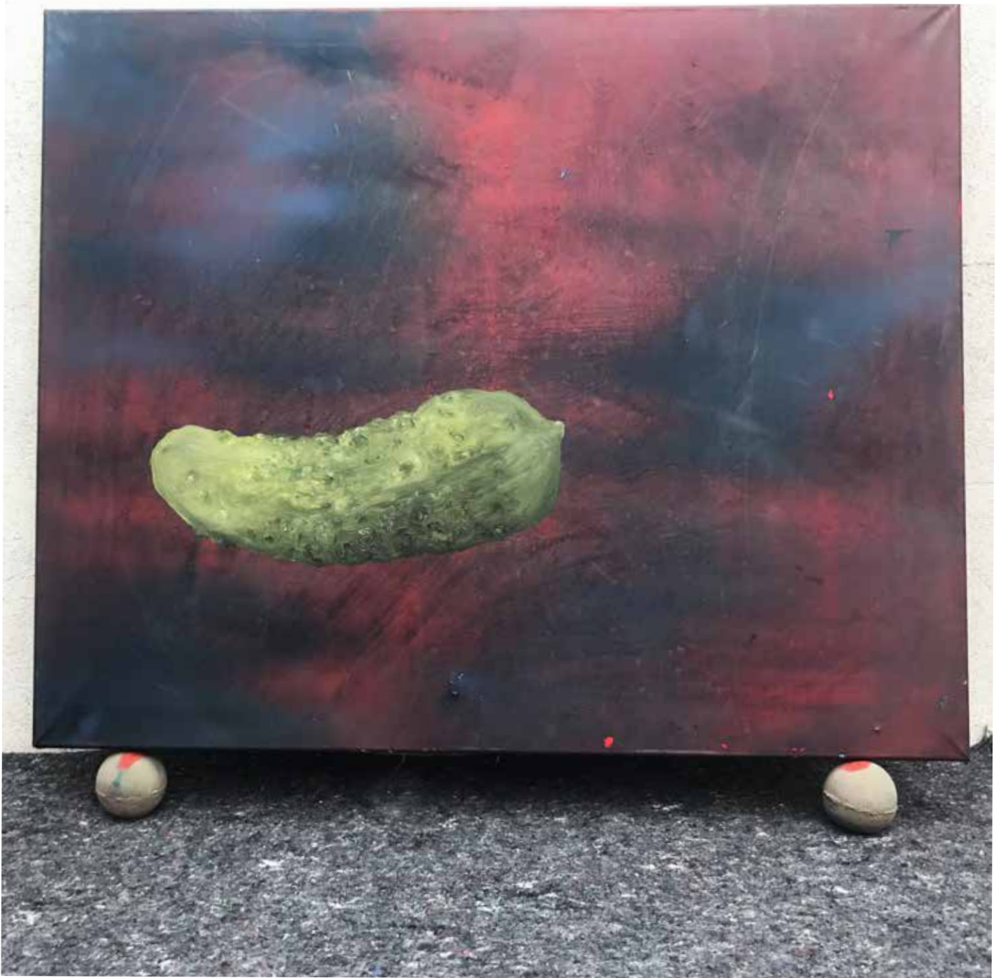
Puissance dans son élément , 2016-2017, huile sur toile 65x85cm, boules en béton coloré, bâche de protection.