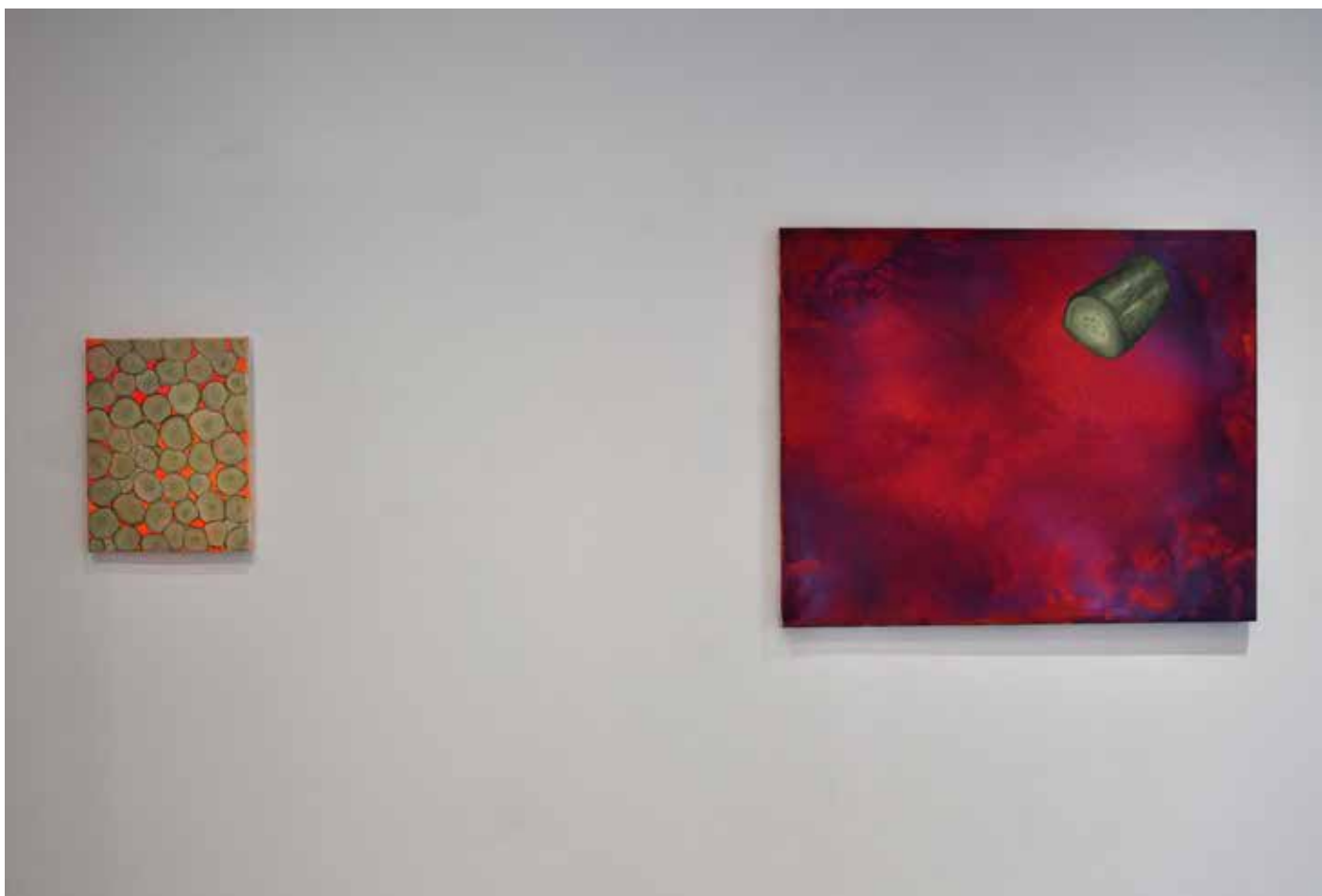
Vue de l'exposition Acide Cosmique , Galerie Simple, Paris, 2017. La multiplication cosmique (à gauche), 2017, huile sur toile, 40 x 30 cm. Puissance dans son élément (à droite), 2016 huile sur toile 65x85cm