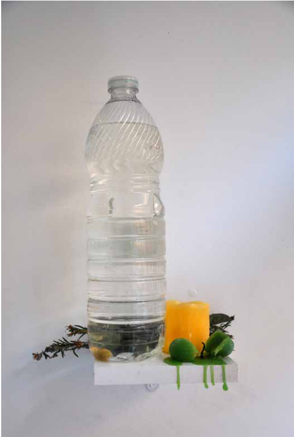
Autel de veille , 2017, bougie de cornichon moulé, bougie LED, feuille de plant de cornichon, branche de romarin, cornichon cultivé en atelier mise en saumure sur étagère vissée au mur.