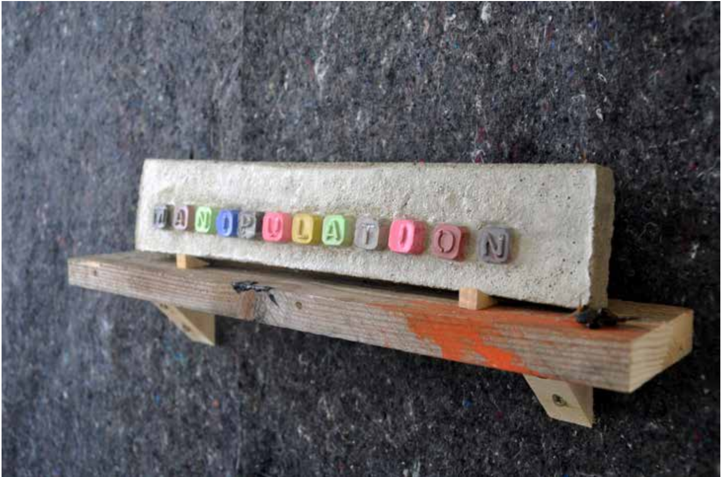
Vue d'atelier, 2017 , série Memento Moris, Manipulation, bâche de protection agrafée au mur, étagère en bois, béton, pigment, env. 180 x 140 cm.