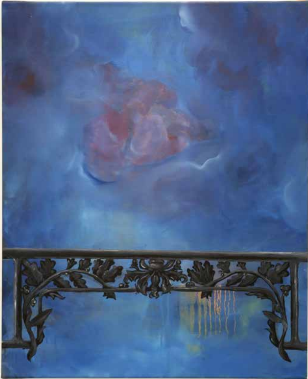
Latence # 6, 2014, huile sur toile, 100 x 70 cm.