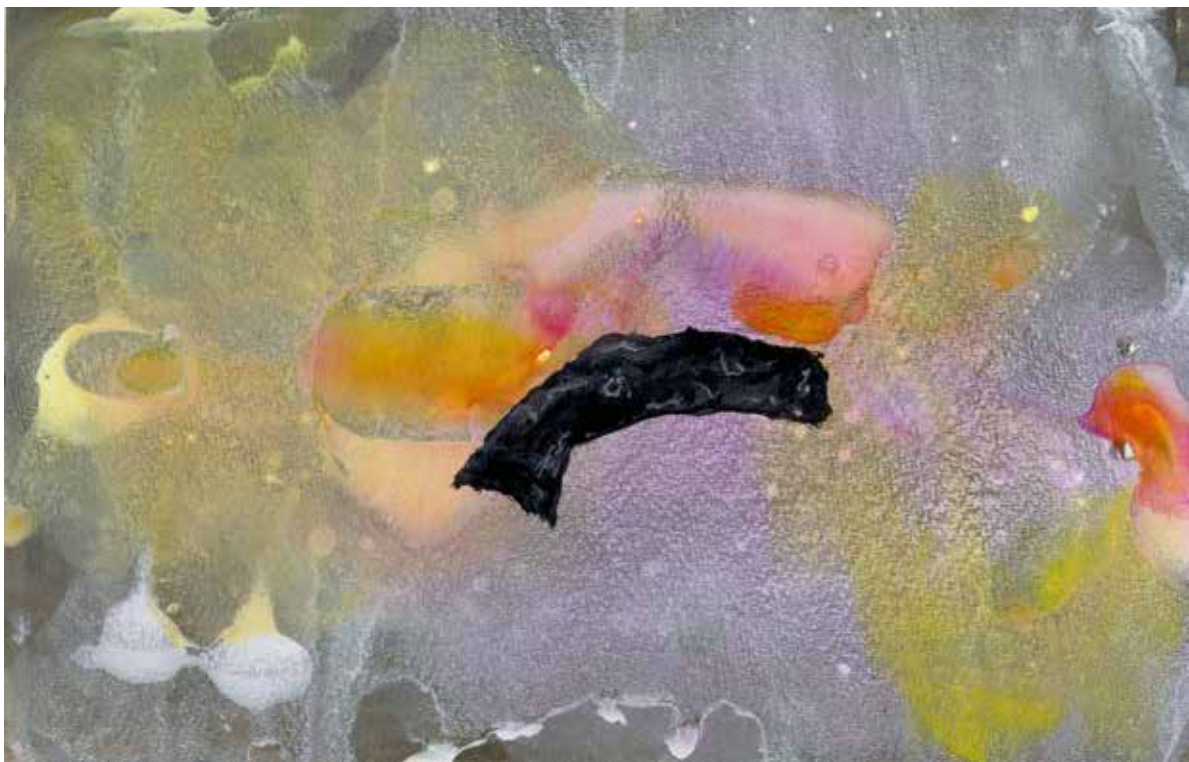
Panlogismes , 2015, acrylique sur papier, détail. format divers.